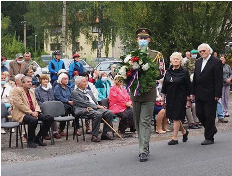
Setkání PTP Svatá Dobrotivá