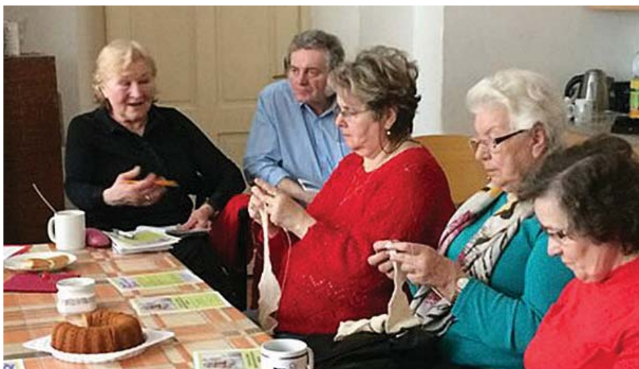
Pletařky z Teplice