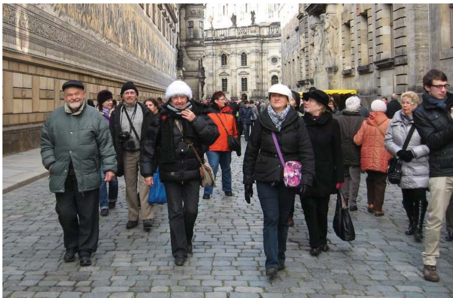
Z adventního zájezdu do Drážďan