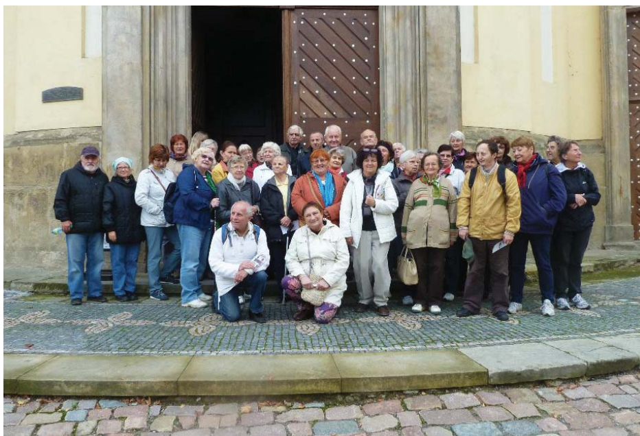
Ze zájezdu Klubu Praha 11