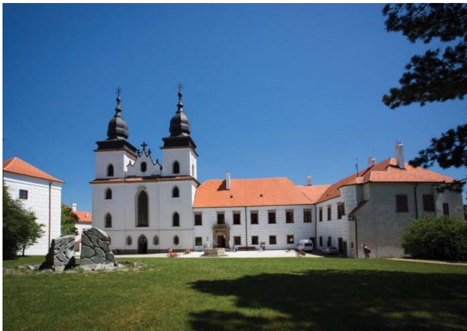
Bazilika sv. Prokopa v Třebíči