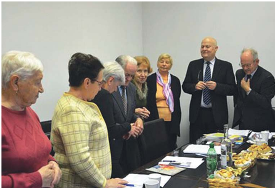
Ze setkání se slovenskými seniory v Bratislavě