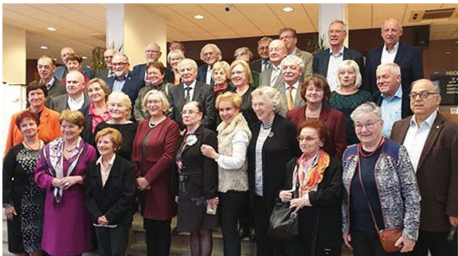
Ze zasedání ESU v Praze