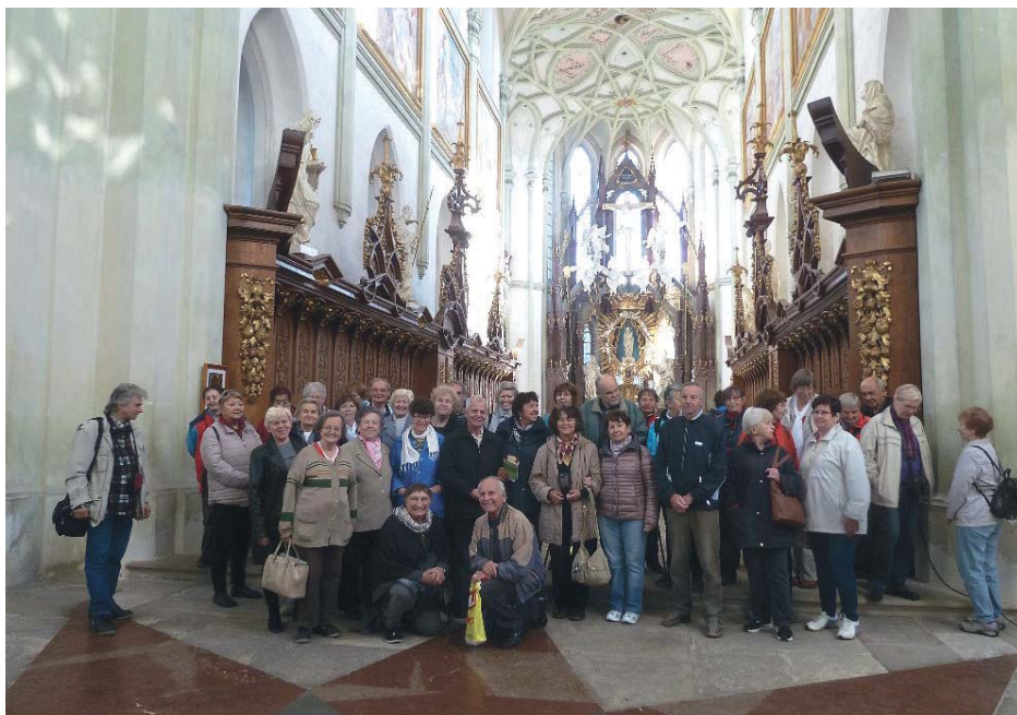
Zájezd Klubu Praha 11 na Tachovsko