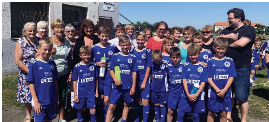
Fotbalový klub Brandýsko