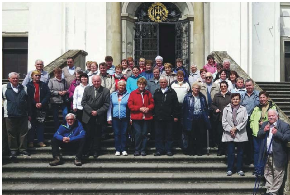
„Rodinné foto“ ze zájezdu žďárského Klubu do Křtin.